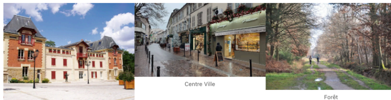
Grange au Bois