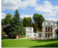
La maison Caillebotte

La ville se distingue par sa qualité d'environnement naturel et apaisant comme la Maison Caillebotte, es